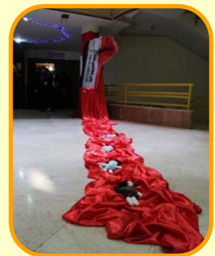
سمینار سیستم های مد و طراحی لباس